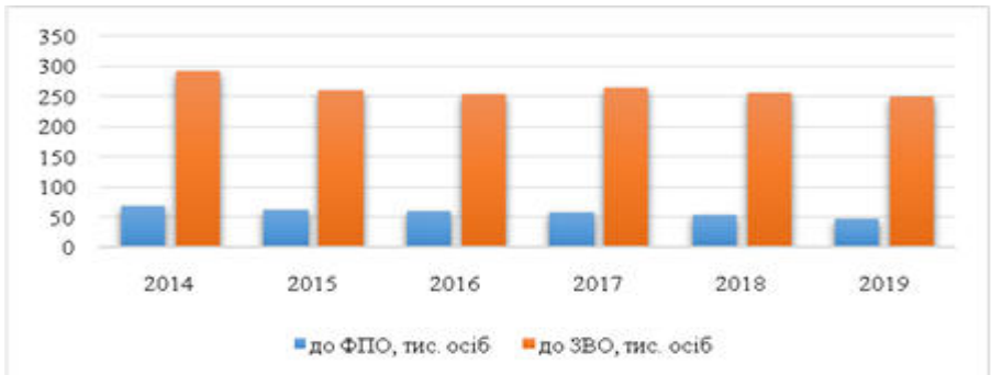
Рис. 3. Динаміка кількості прийнятих на навчання до закладів освіти

Демографічна криза народжуваності в Україні припадає на 2001 рік, народжуваність поступово зростає до 2012 року, а потім знову різко падає (див рис.4). Це зумовить скорочення кількості абітурієнтів, а отже й жорстку конкуренцію між закладами освіти за своїх абітурієнтів.