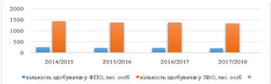
Рис. 2. Динаміка кількості здобувачів освіти