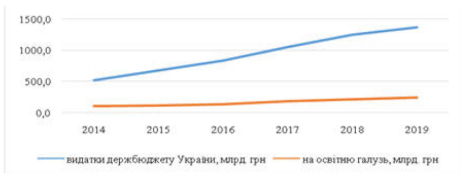
Рис. 5. Видатки зведеного бюджету України (функціональна класифікація)

відбувається скорочення кількості тих, хто навчається, і, відповідно, погіршення якості освіти.